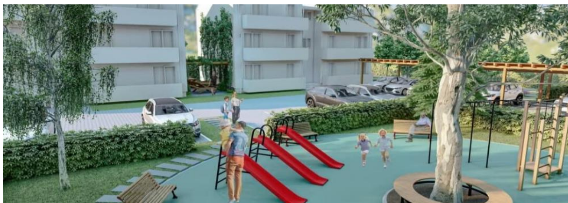
Construire locuințe de serviciu pentru specialiști din sănătate și învățământ

➤ S-au început lucrările de „Construire locuințe nZeb plus pentru tineri/locuințe de serviciu pentru specialiști din sănătate și învățământ” finanțat prin PNRR;