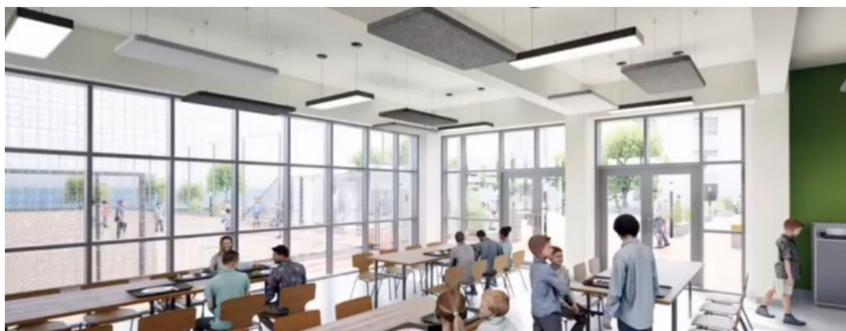
Proiect - Reabilitarea, modernizarea și extinderea Liceului Teoretic „Samuil Micu” Sărmașu”